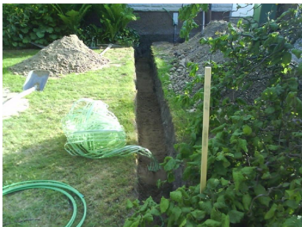
ca 10-15 cm bredd